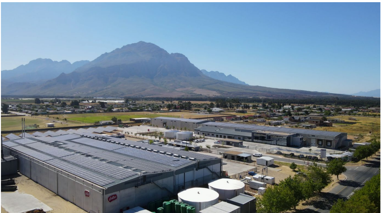
Lotus Bakeries productiesite, Wolseley, Zuid-Afrika

De sterke prestaties van de BEAR®-fabriek en de flexibiliteit van de activiteiten waren de belangrijkste drijfveren achter de beslissing om de fabriek in Wolseley uit te breiden met een extra productiefaciliteit voor de productie van de nākd® raw bars. In de tweede helft van 2023 heeft het team opnieuw zijn capaciteiten bewezen door de nieuwe fabriek in de kortst mogelijke tijd in gebruik te nemen. Hierdoor kon de eerste commerciële productie al in januari 2024 plaatsvinden. Een officiële openingsceremonie staat gepland voor februari 2024 in aanwezigheid van de CEO Jan Boone, de Belgische ambassadeur en consul-generaal in Zuid-Afrika en Zuid-Afrikaanse functionarissen. De nieuwe fabriek in Zuid-Afrika zal de productie voorzien voor de internationale vraag naar nākd bars.